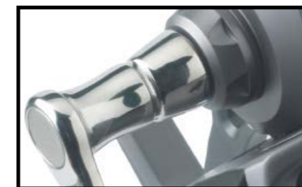
Bremsschlüssel im Lieferumfang bei VM 150 / VM 275